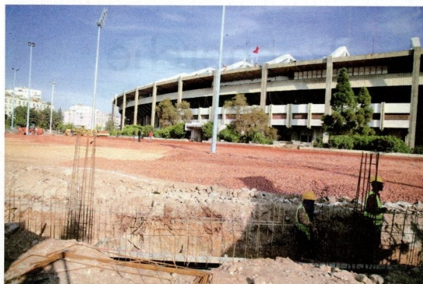
La phase II du projet de réhabilitation du complexe Mohammed V consiste à aménager l'extérieur du stade et à installer l'éclairage et la sonorisation