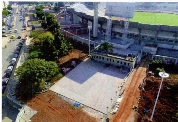
La 1re phase des travaux a porté essentiellement sur la rénovation des vestiaires, le remplacement des sièges ainsi que l'installation d'un panneau d'affichage, des tourniquets

La prochaine phase sera celle de l'aménagement du bassin olympique et de la salle omnisports.